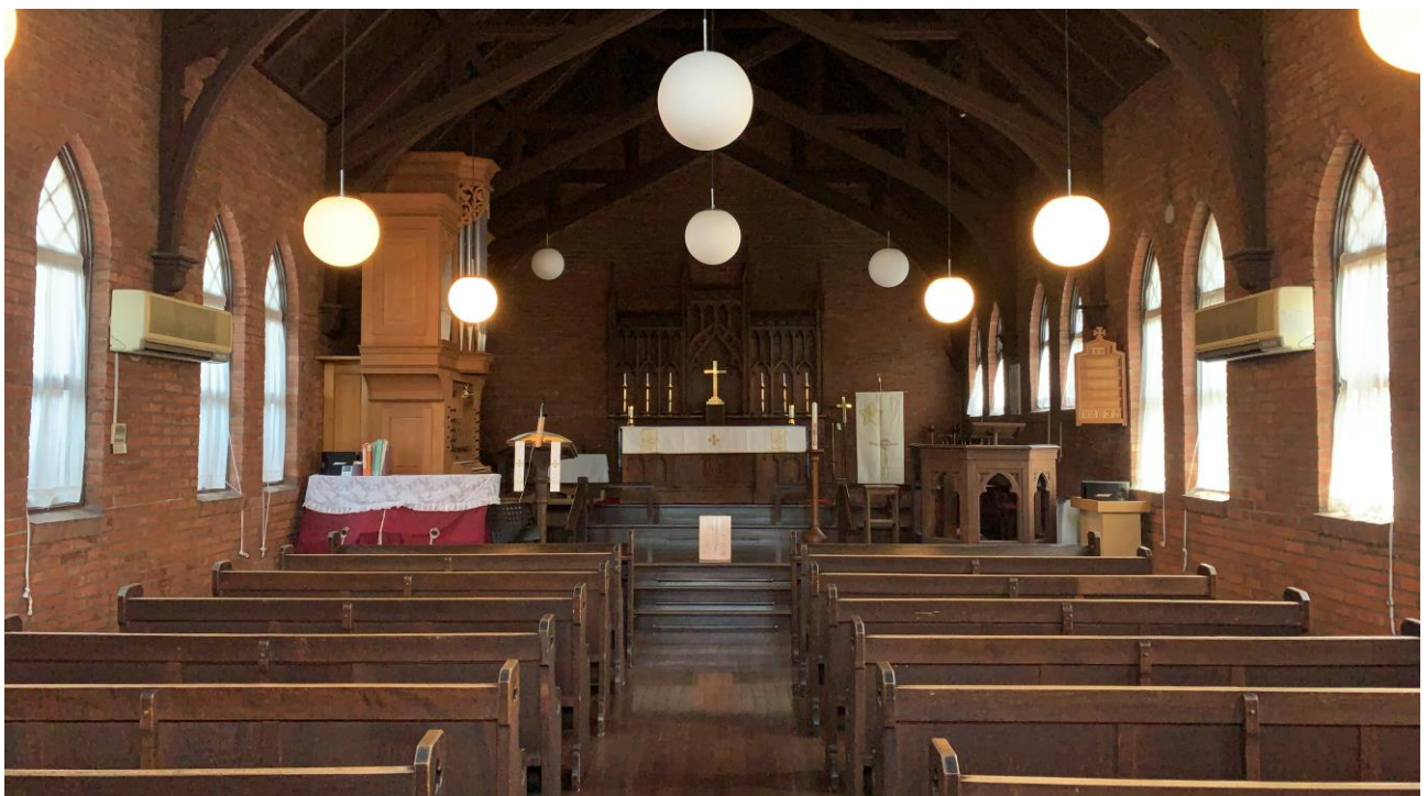
礼拝再開を待つ川越キリスト教会礼拝堂